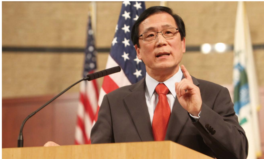
어바인 시장 시절 연례 시정연설을 하는 모습 © 강석희