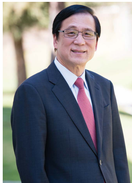
강석희 전 어바인 시장 © 강석희

(스마트 성장)과 주택 정책(Housing & Responsible Growth) △교통 정체 해소와 인프라 현대화(Transportation & Traffic Relief) △지역 경제 활성화와 소상공인 지원(Economic Vitality) △환경 지속 가능성과 도시의 미래 보호(Environmental Sustainability) 등 어바인의 미래를 위한 7대 공약을 제시했다.